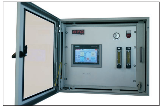
Referenzluftkasten u. lokale Signalauswertung (U-Flamme, 2 Sonden)