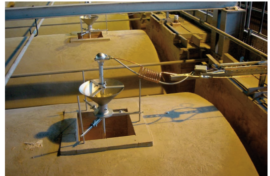
Sonden installiert auf den Regeneratoren einer querbeheizten Schmelzwanne